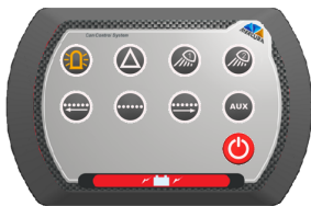
Boitier CCS 8 Défilement[/caption]

[caption id="attachment_21386" align="alignnone" width="171"]