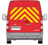
option arrière tôle */[/caption]