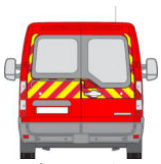
arrière partiel[/caption] [caption id="attachment_21226" align="alignnone" width="80"]