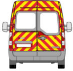
arrière total[/caption] [caption id="attachment_21223" align="alignnone" width="80"]