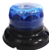
Embase ISO XS