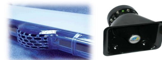
Rampe Vega la seule rampe extraplate avec sirène homologuée